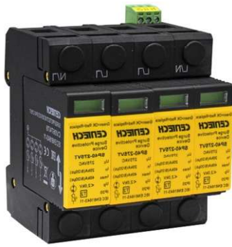
Inntaksvern plassert i sikringskapet