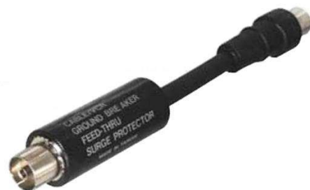
Galvanisk skille mellom TV og TV-kontakt/dekoder

Mellom TV-kabelen din og TV-kontakten eller dekoderen skal det sitte et galvanisk skille, dette gjelder kun kabel-tv. Denne sørger for at ikke spenninger på avveier kommer inn i TV-en, noe som igjen kan før til brann.