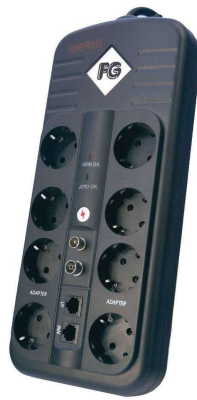
Utstyrsvern, plugges mellom utstyr og stikkontakt