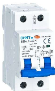
Automatsikring med jordfeilbryter